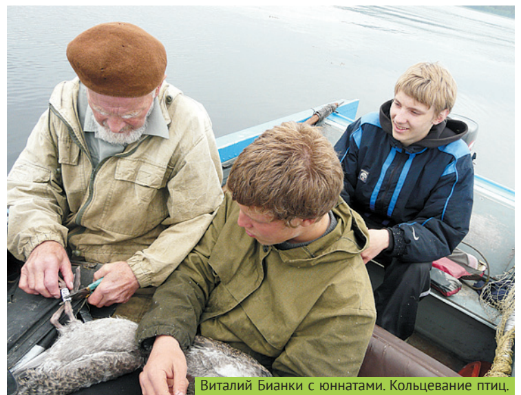
Виталий Бианки с юннатами. Кольцевание птиц.