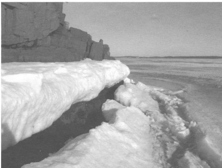
Берег Белого моря зимой