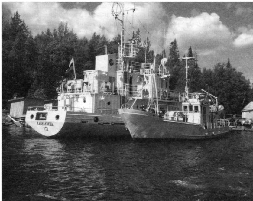
Научный флот Беломорской биологической станции Зоологического института РАН